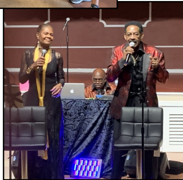
Amélioration de l'éclairage lors d'une performance récente