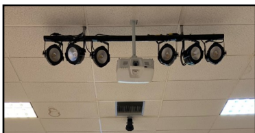
Lumières de la scène

L'équipe de cuisine aimerait remercier Susanne Roy pour les nouveaux tabliers colorés pour nous aider à rester propres.